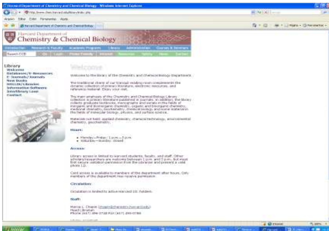
Figura 1: Site da Biblioteca do Departamento de Química e Biologia Química da Universidade de Harvard ( Department of Chemistry and Chemical Biology )