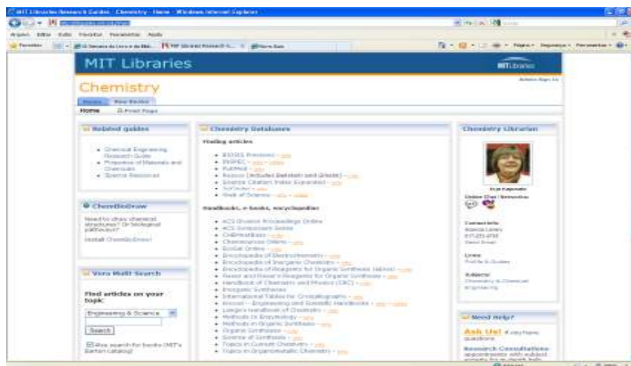
Figura 2: Site da Biblioteca do Departamento de Química do MIT